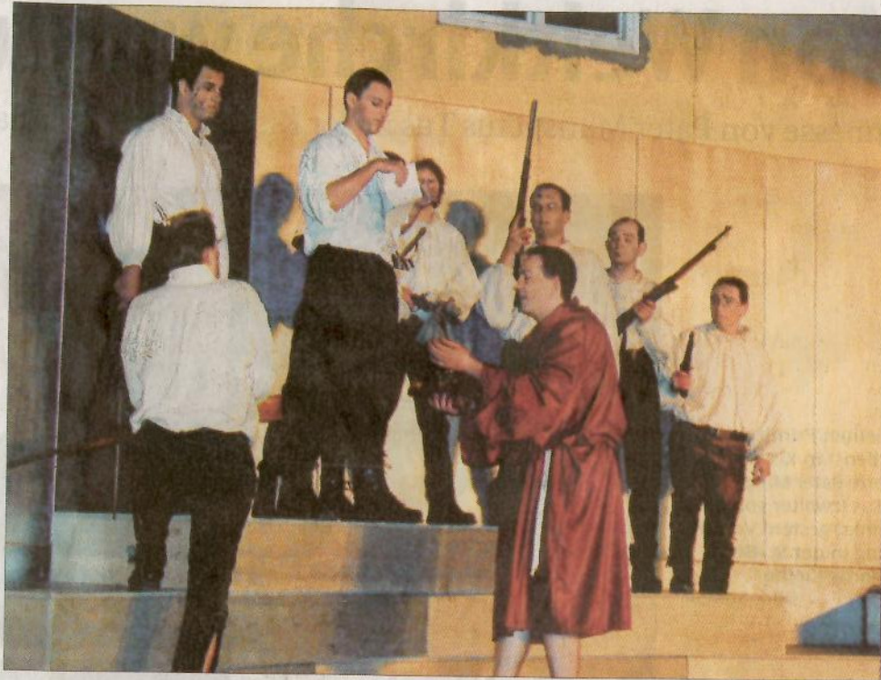
Durchwegs positive Resonanz erhielt die Freiluftaufführung „Die Räuber“ des Neuen Theaters Mering. Hier macht die Räuberbande um Karl Moor selbst vor einem Pater nicht halt.